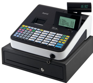
Die ECR-1800 mit Hubtastatur (Die Abbildung zeigt als Sonderausstattung das Addinat Kellnerschloss)

Die Tastatur, die Wahlweise als Flach- oder als Hubtastatur erhältlich, ist frei programmierbar. So lässt sich das System auf Ihre Anforderungen einrichten. Nützliche Funktionen wie z.B. Menüfenster vereinfachen die Bedienung und verkürzen Einweisungszeiten. Leistungsrahmen