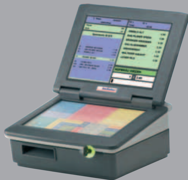
Abbildung: INKA 400 mit Bondrucker