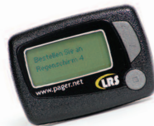
Batteriebetriebener, alphanumerischer Pager