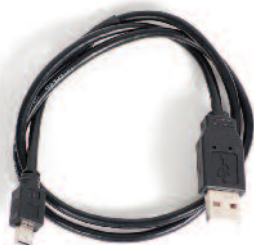
CD zur Programmierung (nicht abgebildet) und Kabel.

Beach Butler kann mit beiden alphanumerischen LRS-Pagern benutzt werden.