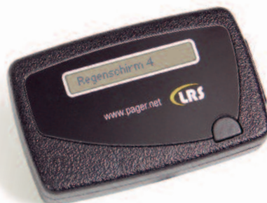
Wiederaufladbarer, alphanumerischer Pager