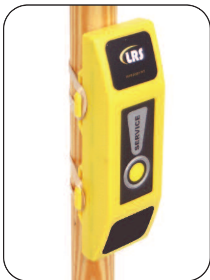
Beach Butler kann auch mit Gummibändern, Klettverschluss oder der extra zu bestellenden Schirmhalterung angebracht werden.