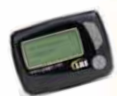
Multi-Kanal alphanumerischer Pager