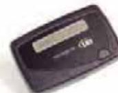
und 1-Kanal alphanumerischer Pager